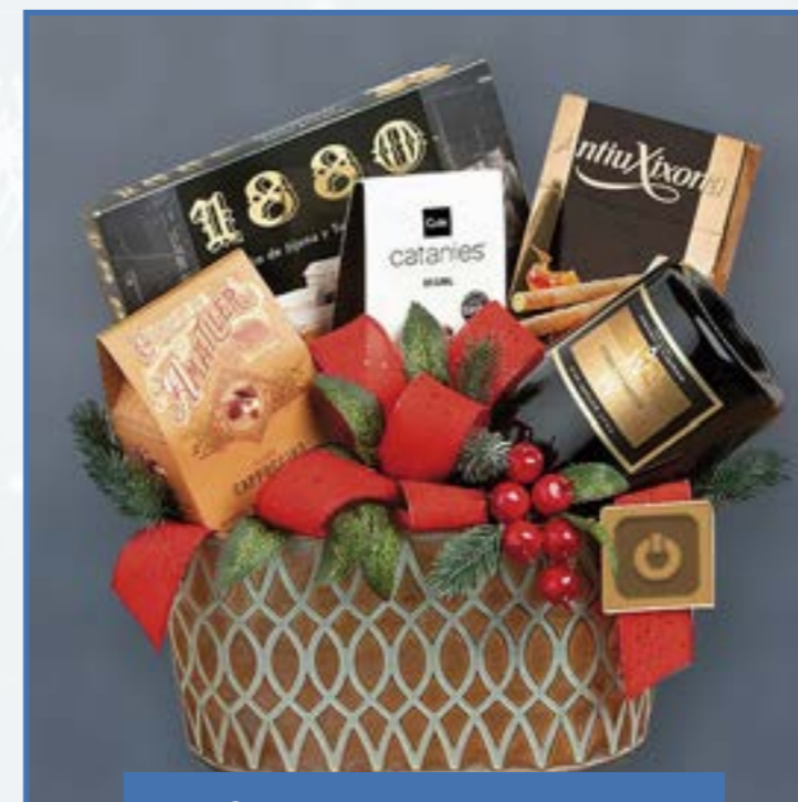
Ref. M - 4