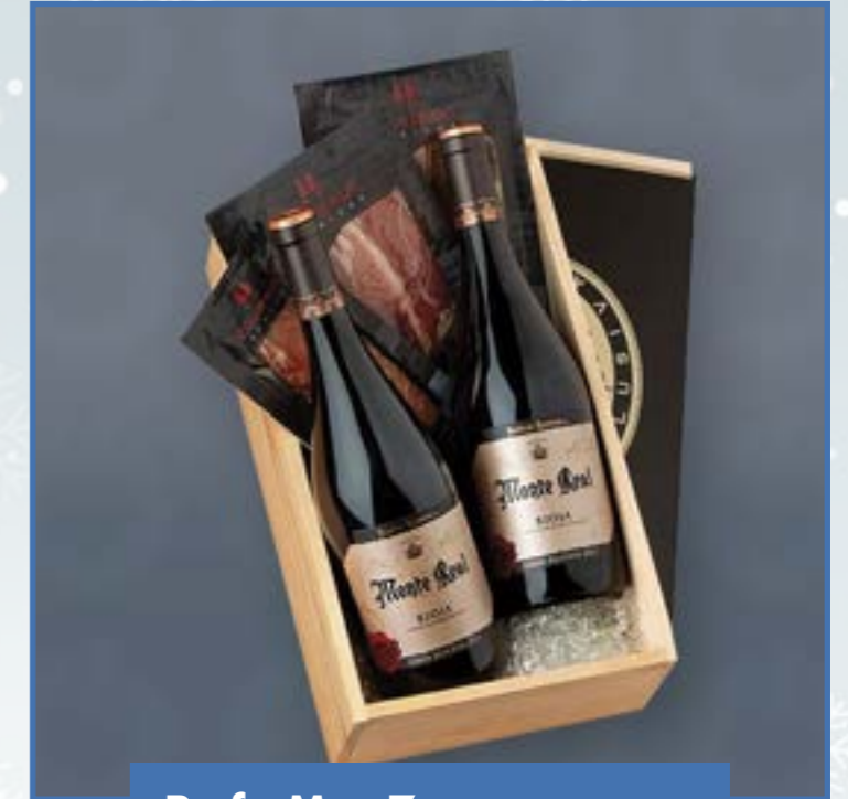
Ref. M - 7