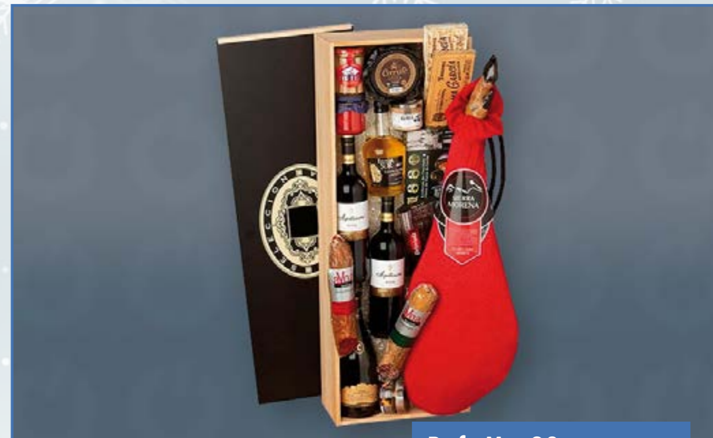
Ref. M - 23