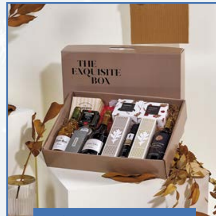
Ref. D - 8