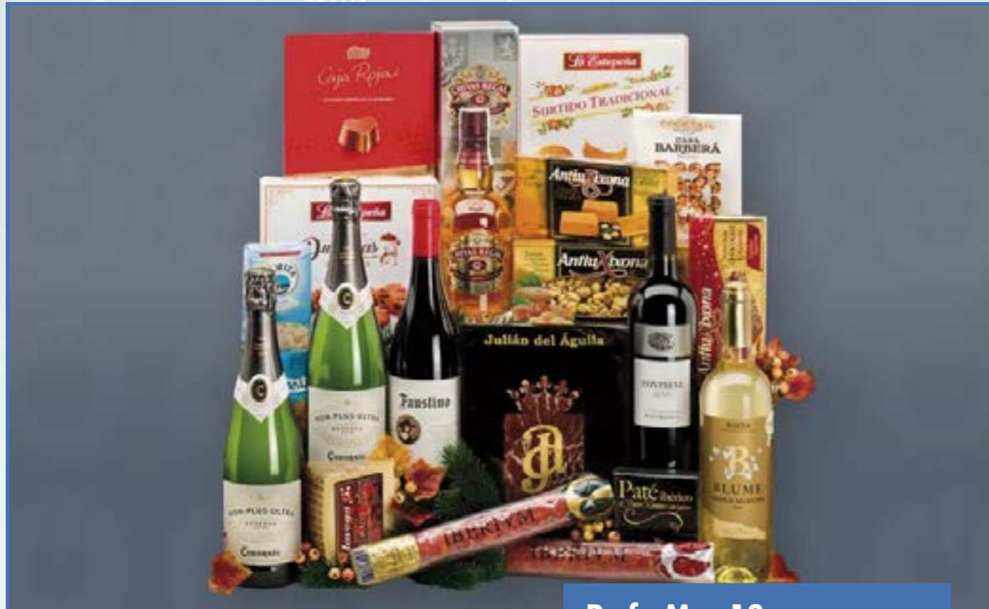
Ref. M - 13