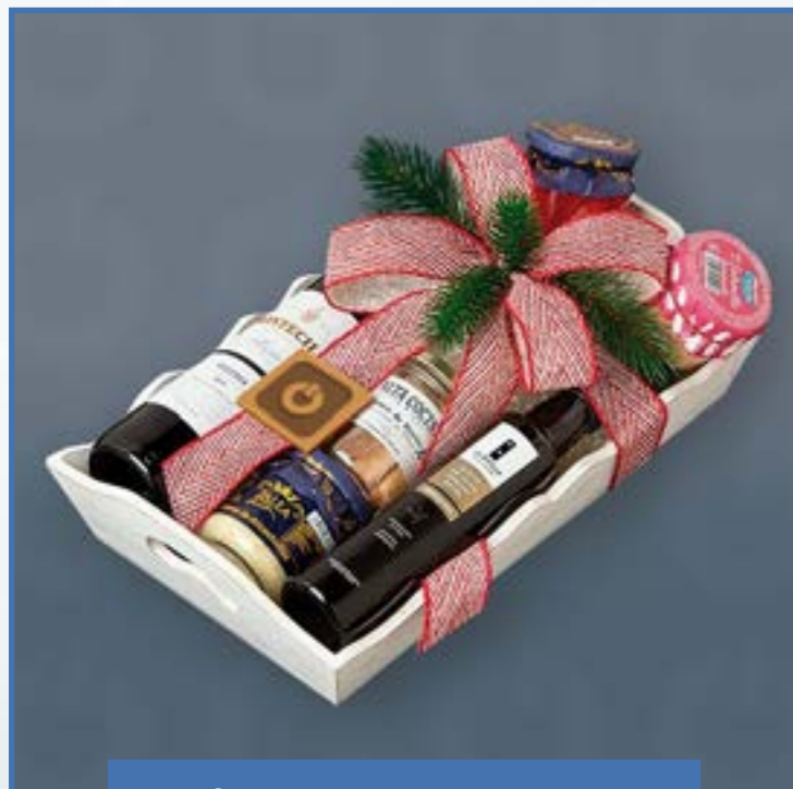
Ref. M - 6