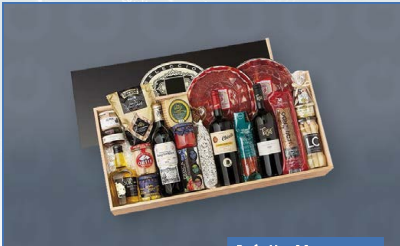
Ref. M - 22