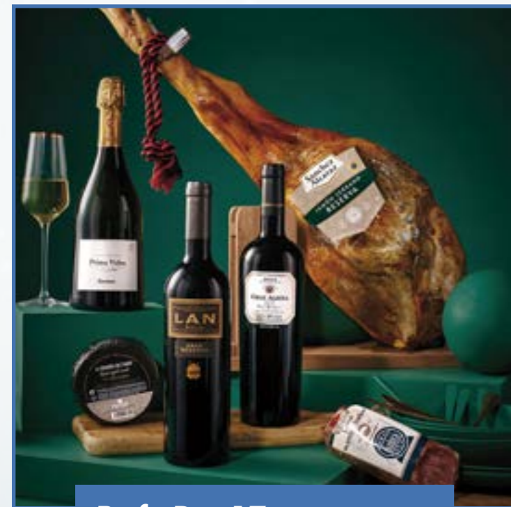
Ref. D - 17