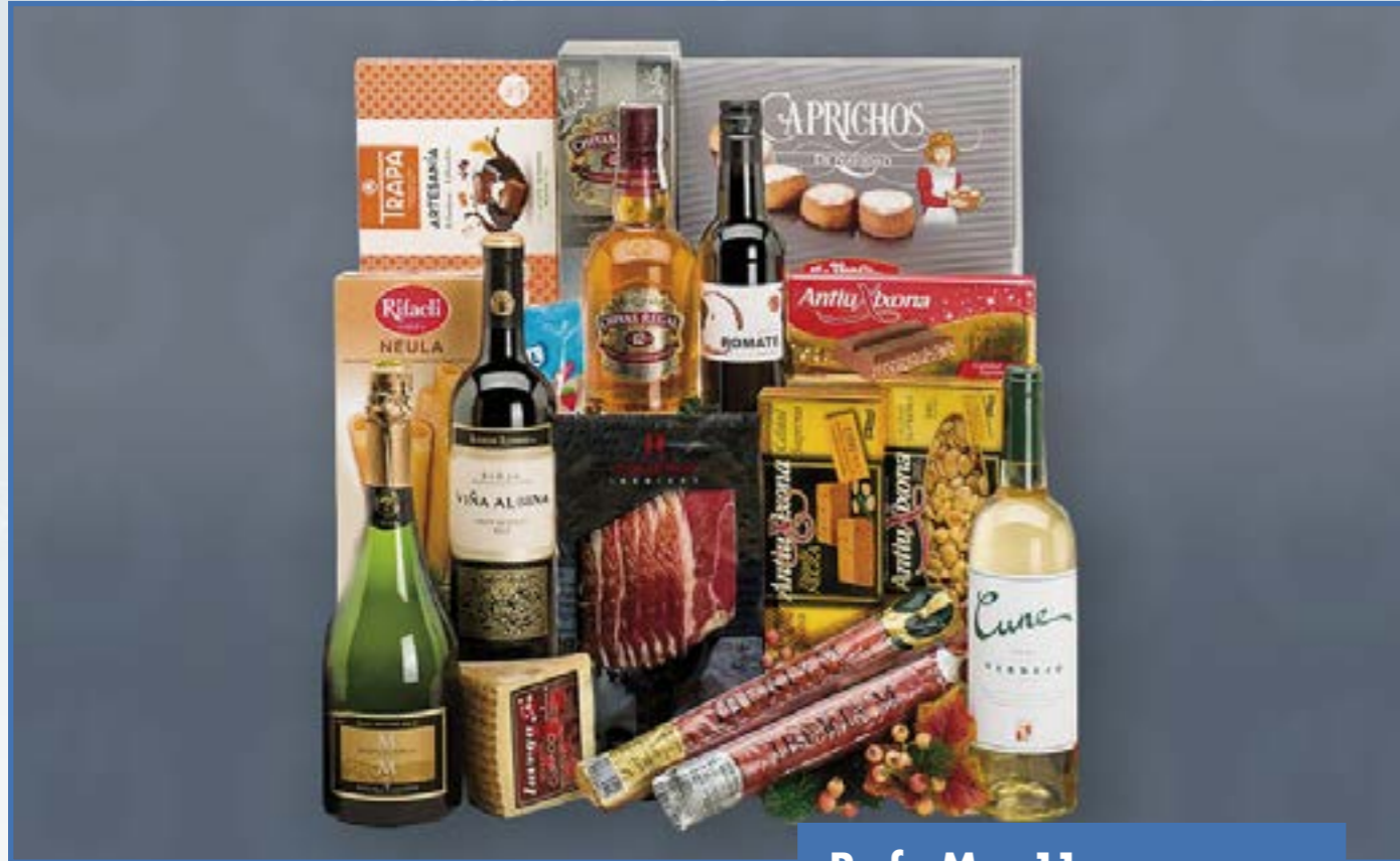
Ref. M - 11