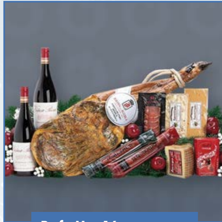
Ref. M - 16