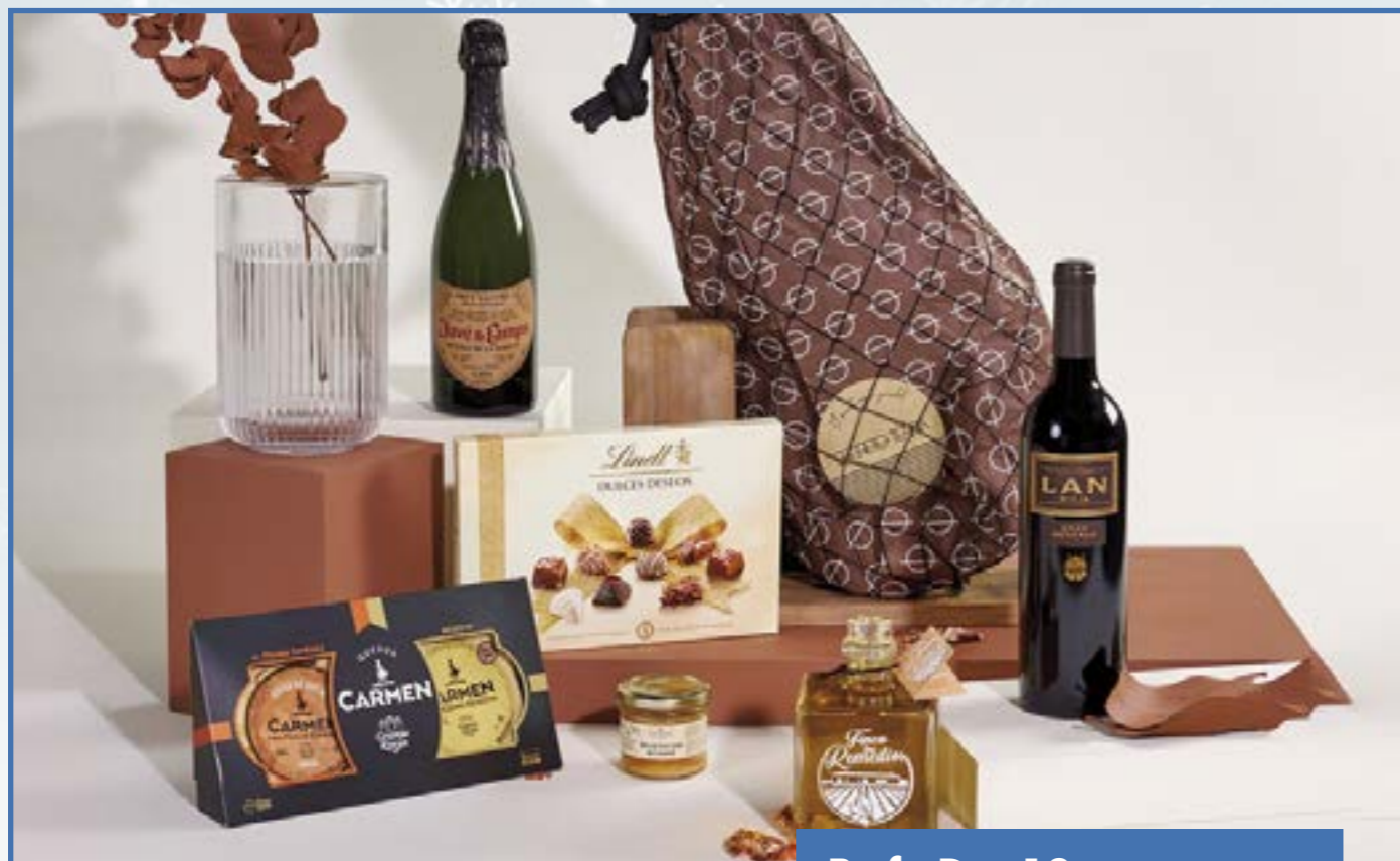
Ref. D - 18