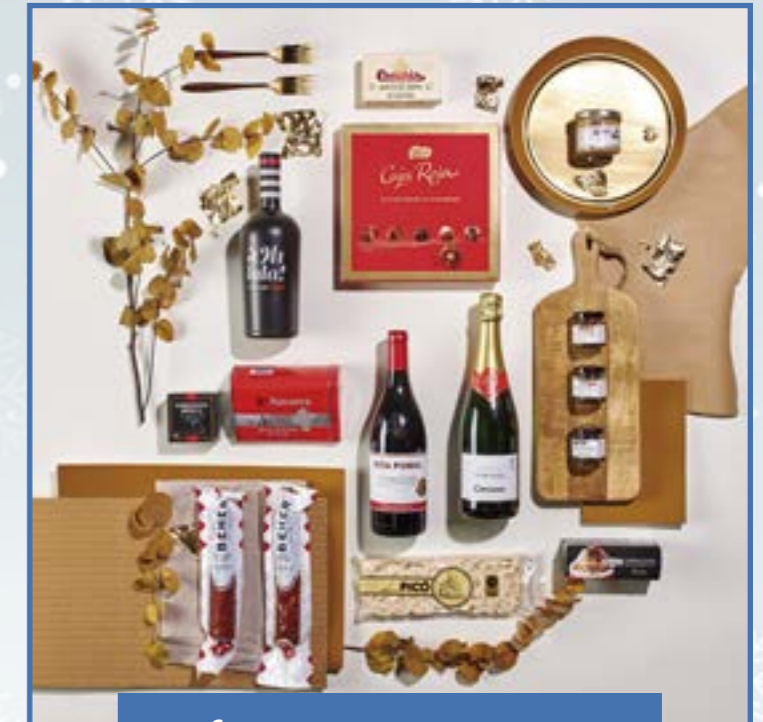
Ref. D - 14