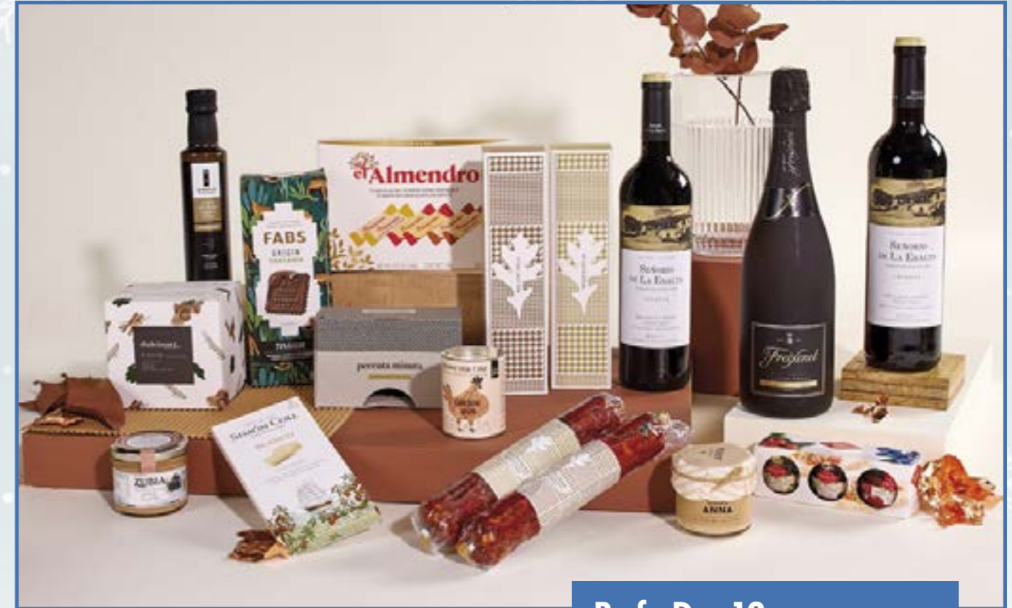
Ref. D - 12