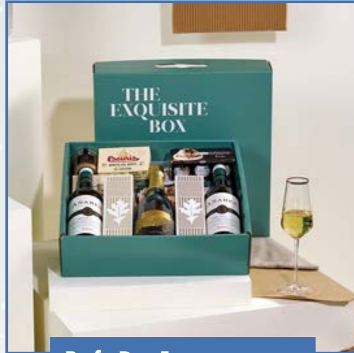
Ref. D - 5