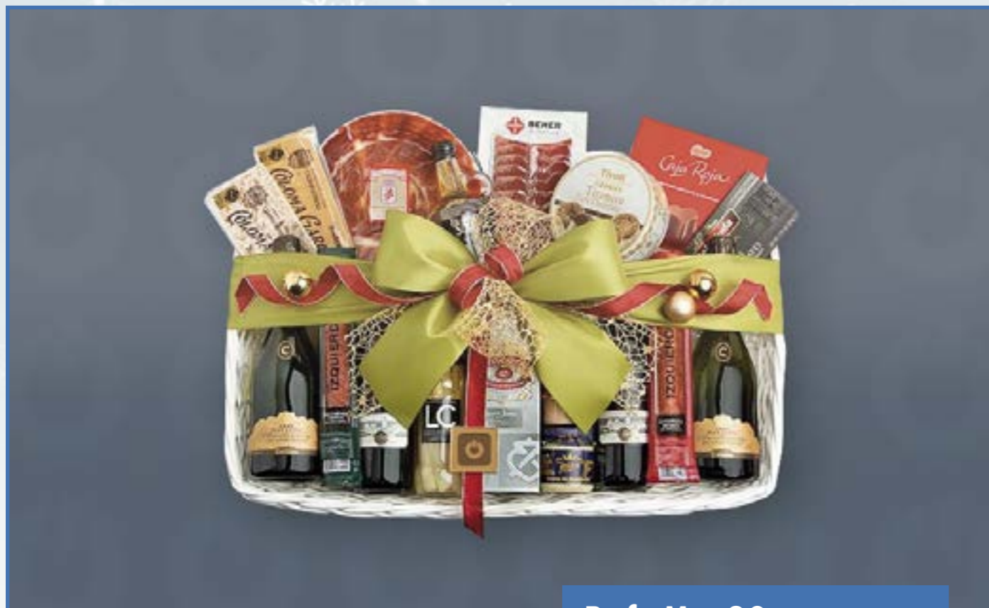
Ref. M - 20