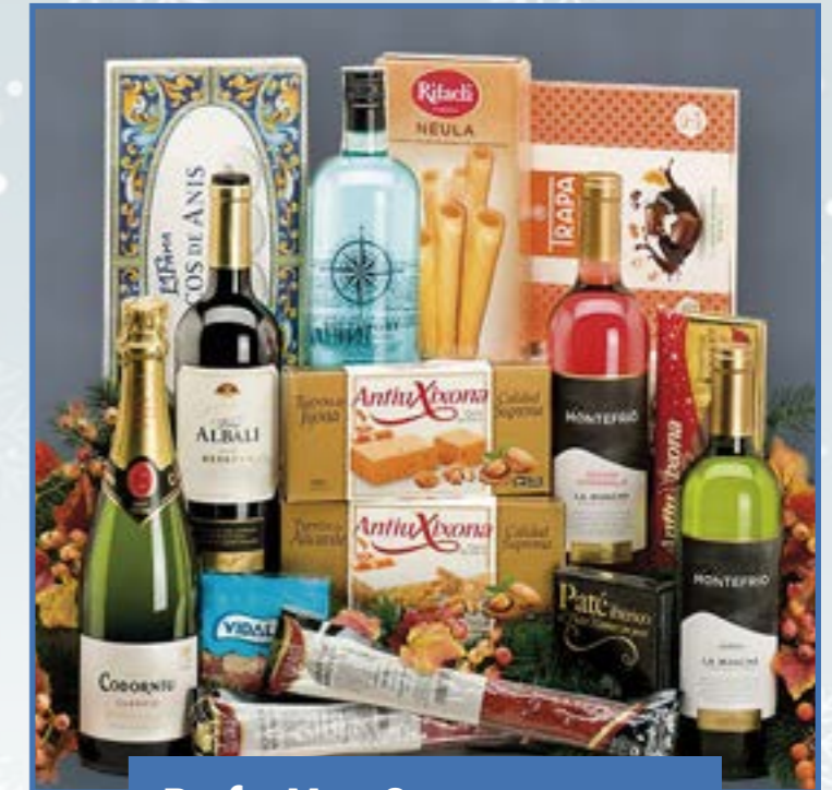
Ref. M - 3