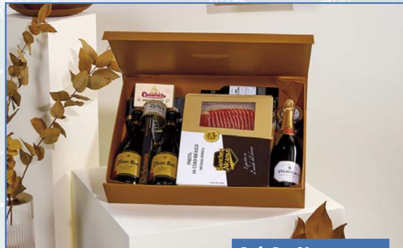
Ref. D - 21