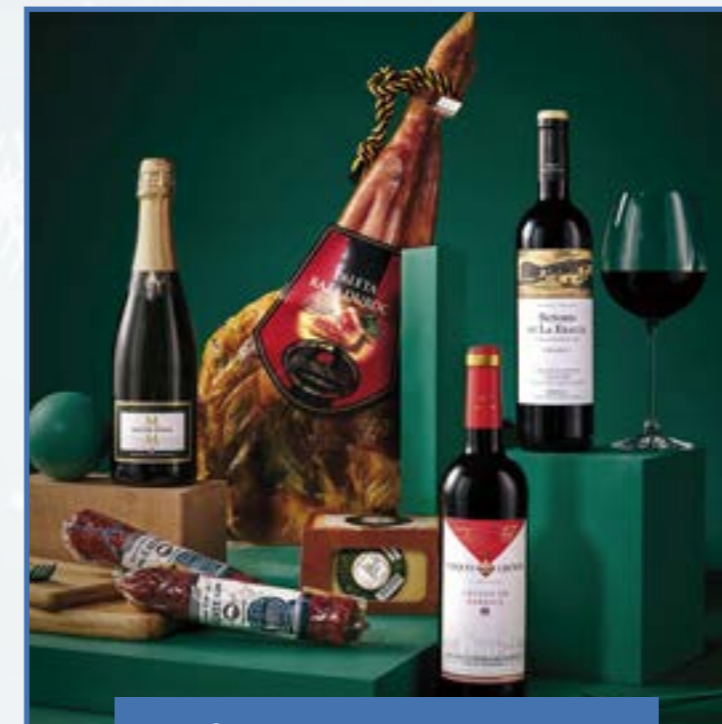
Ref. D - 15